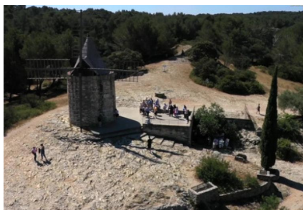
Un haut lieu du tourisme à Fontvieille : le moulin d'Alphonse Daudet