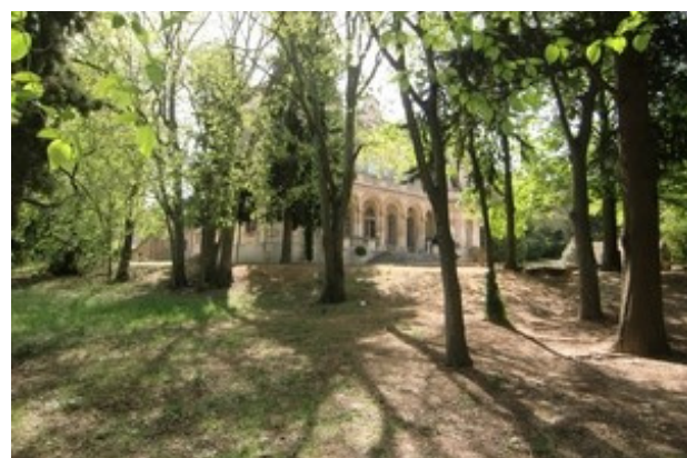
Un des sites de l'évènement : le Parc du Château de Montauban